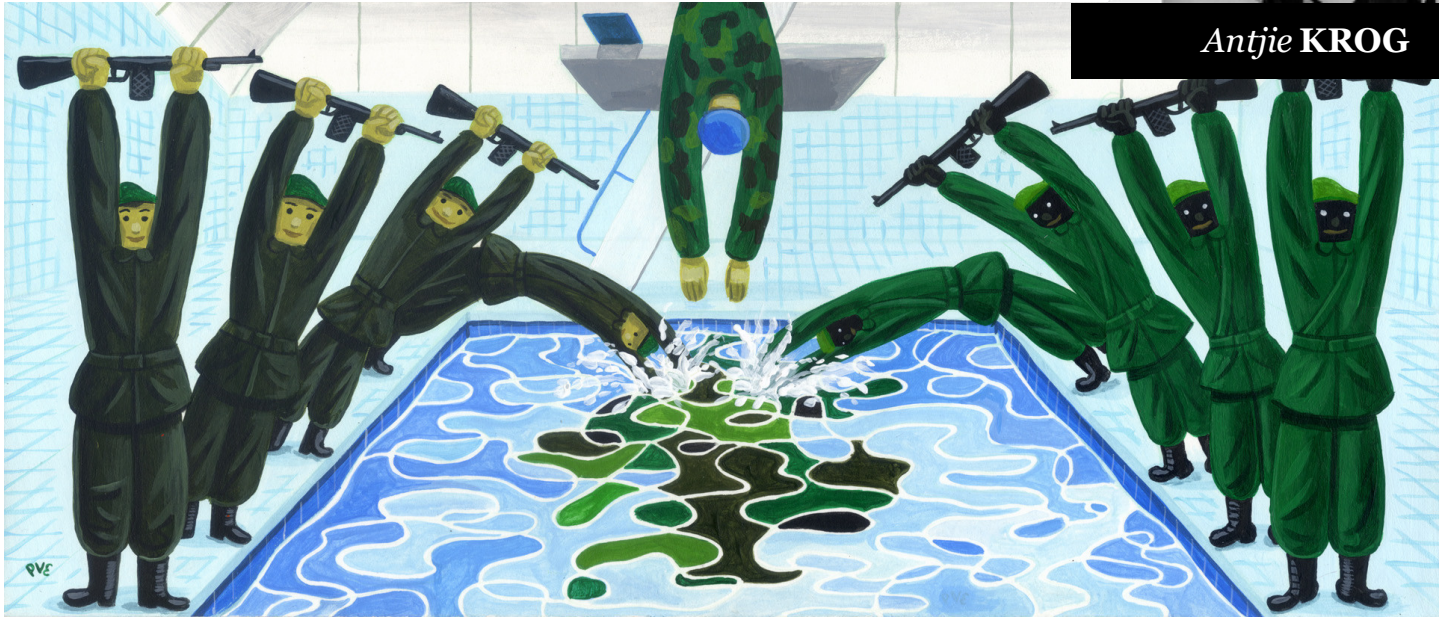
Illustratie: Pieter Van Eenoge (voor De Correspondent)

E én van de hardnekkigste mythes van de westerse wereld is het idee dat elk individu vrij, uniek en autonoom is. We zijn geobsedeerd door het individu terwijl uit DNA-onderzoek blijkt dat alle mensen voor 99 procent hetzelfde zijn.