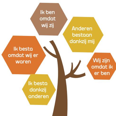
Figuur 1. Ik ben omdat wij zijn

Het boek telt twaalf hoofdstukken die alle over Ubuntu gaan maar steeds vanuit een andere invalshoek, namelijk: spiritualiteit, vergelding of verzoening, herstelrecht en verzoening, vergeving, onderwijs, leiderschap, ondernemerschap en de kracht van de gemeenschap, hoop – geloof en liefde na de apartheid, diversiteit en cocreatie en... Moeder Aarde. Hiermee is de inhoud van het boek al aardig getypeerd. Kern van Ubuntu is de uitdrukking: "Ik ben omdat wij zijn" (Figuur 1). Die staat voor een visie op mens en maatschappij die berust op saamhorigheid, samenwerking en gemeenschappelijkheid. Inherent aan die visie is onder meer het besef dat de mens niet de schepper van zichzelf is, er eigenlijk geen persoonlijk bezit is (zou moeten zijn) en dat sociale verhoudingen gebaseerd moeten zijn op onderlinge liefde en goedheid voor elkaar. Je zou uit het boek van Mul kunnen afleiden dat een zekere meertaligheid nodig is om Ubuntu te kunnen denken. In het boek wordt naast Nederlands vaak Engels gebruikt, en op cruciale plaatsen ook Afrikaans-Nederlands of woorden uit een inheemse Afrikaanse taal.